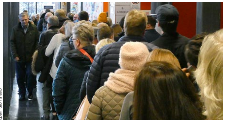
A.m.k. 40 mínútna biðröð myndaðist við kjördeild 5 í Lækjarskóla á meðan engin biðröð var í kjördeild 4 eða 6!

Nýir inn eru Guðmundur Andri Thorsson, Gunnar Bragi Sveinsson, Willum Þór Þórsson, Ólafur Þór Gunnarsson og Guðmundur Ingi Kristinsson. Þeir Guðmundur Andri og Guðmundur Ingi hafa ekki setið á þingi áður.