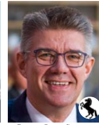
Gunnar Bragi Sveinsson Miðflokkurinn