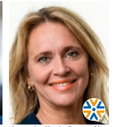
Þorgerður Katrín Gunnarsdóttir Viðreisn