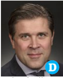
Bjarni Benediktsson Sjálfstæðisflokkurinn