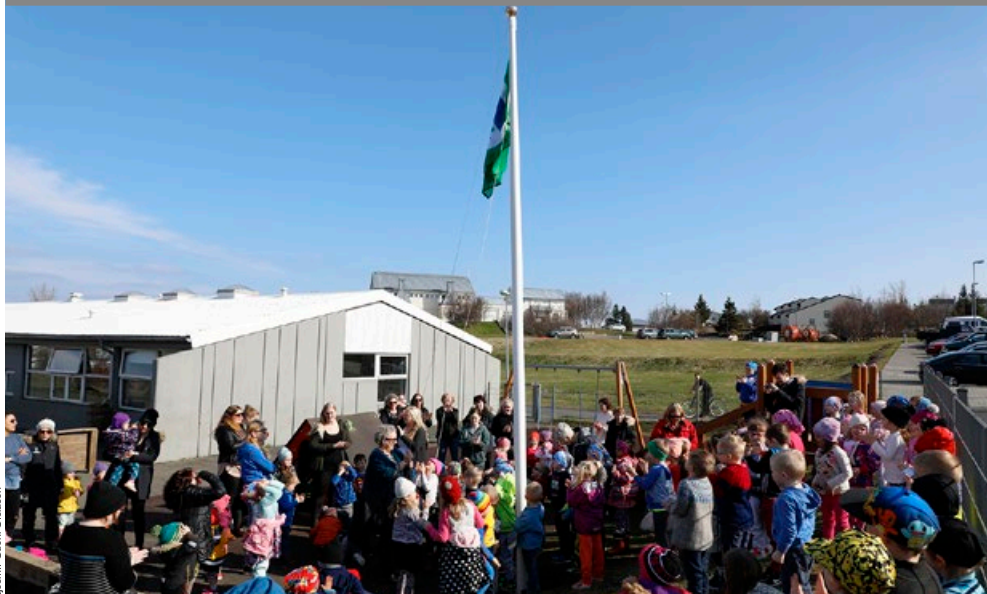
Fáninn dreginn að húni og krakkarnir fylgjast spenntir með.

Leikskólinn Hvammur tók á móti Grænfána á 29 ára afmæli skólans