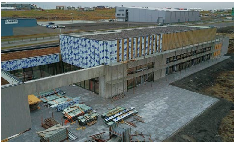
Fyrri áfangi Ástjarnarkirkju er langt kominn og verður húsnæðið vígt í haust.

Húsnæðið er fyrri hluti kirkjubyggingarinnar en ekkert liggur fyrir hvenær hægt verður að hefjast handa við síðari áfanga og skv. upplýsingum frá kirkjunni er það ekkert á næstunni.