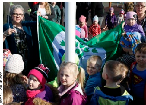
Krakkarnir báru fánann að fánastönginni.

Krakkarnir eru meðvitaðir um tákni fánans og fögnuðu því vel þegar nýr fáni var dreginn að húni fyrir utan skólann.